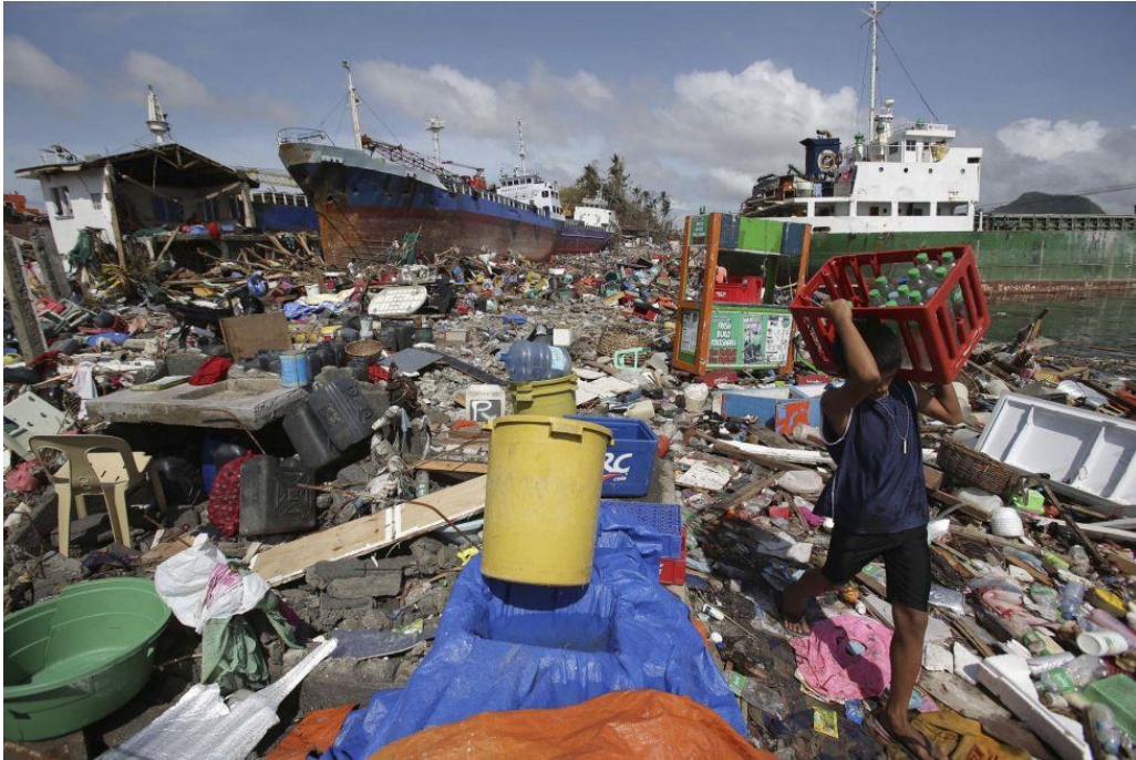
Los barcos en el puerto de Tacloban se introdujeron en el puerto debido al gran oleaje

gran parte del país están colapsadas y la energía eléctrica, la red de agua y las comunicaciones se han visto afectadas.