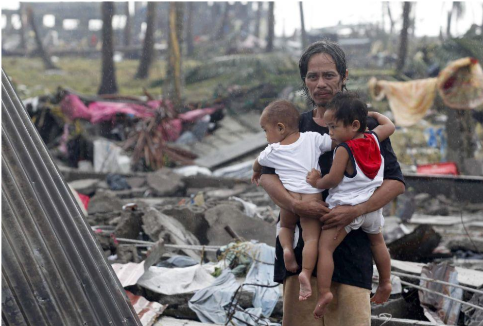
Cientos de miles de personas no disponen de vivienda, ni alimentación, ni agua potable ni atención sanitaria.