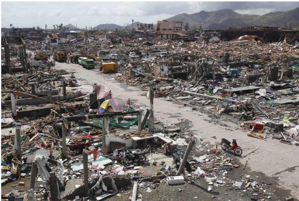
Las imágenes tras el paso de HAIYEN son desoladoras

La mayoría de las muertes se produjeron en la capital provincial, Tacloban, una ciudad de 220.000 habitantes y la más grande de la isla. Entre el 70% y el 80% de las estructuras están destrozadas por donde ha pasado la tormenta. Alrededor de medio millón de personas han sido desplazadas de sus hogares y 4,5 millones se han visto afectadas en 36 provincias de todo el país.