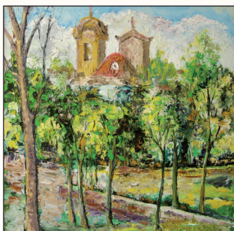
"Es Freginal". Óleo. 55x55 cm.

Precio 30 € (incluye el donativo de 5 € para proyectos del Club) En el transcurso de la cena se sorteará entre los asistentes un cuadro donado por el artista Francisco Fiol.