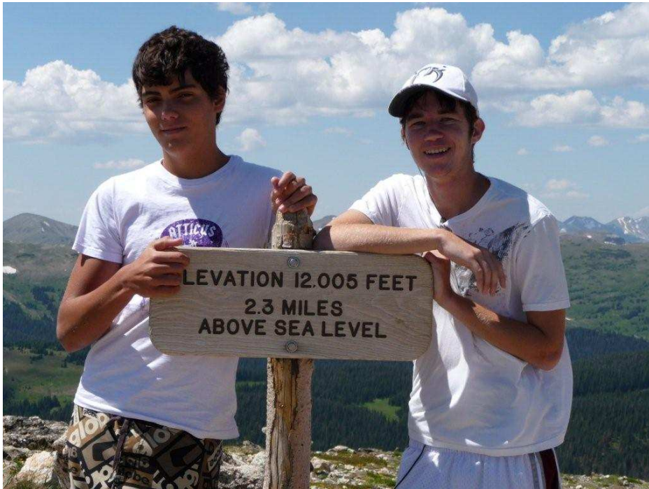
En Las Montañas Rocosas